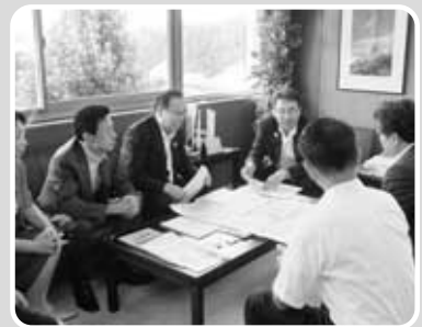
赤澤政務官へ説明