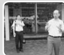
武雄市長からの説明