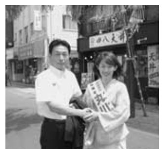
参議院議員選挙にて