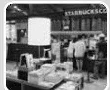
スターバックスが入った市立図書館