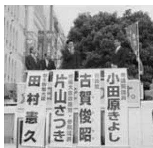
田村厚労相、片山参院議員との街頭活動