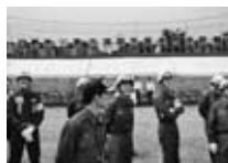
自民党日野総支部大会 商工会館