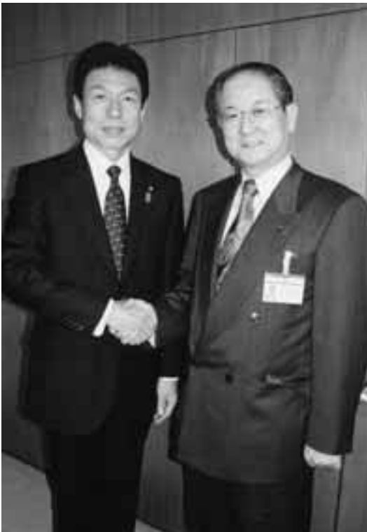
馬場日野市長とガッチリ握手!